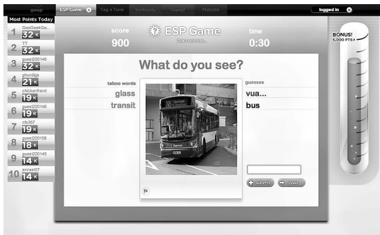
Abb. 1 Aufgabenstellung im ESP Game

Objekte in Bildern zu erkennen oder Sprache zu transkribieren. 8 Überdies komme es in der Welt alltäglich zu einer «immensen Verschwendung menschlicher Hirnzyklen»; 9 man denke allein «an die 9 Mrd. Stunden, die Menschen im Jahr 2003 weltweit Solitär gespielt haben». 10 Menschen seien also gute Rechenmaschinen und ihre Rechenleistung sei auch noch im Überfluss verfügbar – aus diesen beiden Prämissen setzt von Ahn das Programm seiner Forschung im Bereich der HCI zusammen: «Ich werde ein Computerprogramm in menschlichen