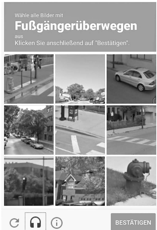
Abb. 2 Beispiel für ein CAPTCHA des Googledienstes reCAPTCHA

Ng stellt nun die interessante Behauptung auf, dass heutzutage genau genommen nur noch der zweite Punkt – die Verfügbarkeit von Trainingsdaten – eine knappe Ressource darstelle. Tatsächlich ist Rechenleistung seit einigen Jahren auf industriellem Maßstab als Dienstleistung verfügbar – Services wie die Google ML-Cloud erlauben es jedem kleinen Unternehmen, DL-Modelle anhand